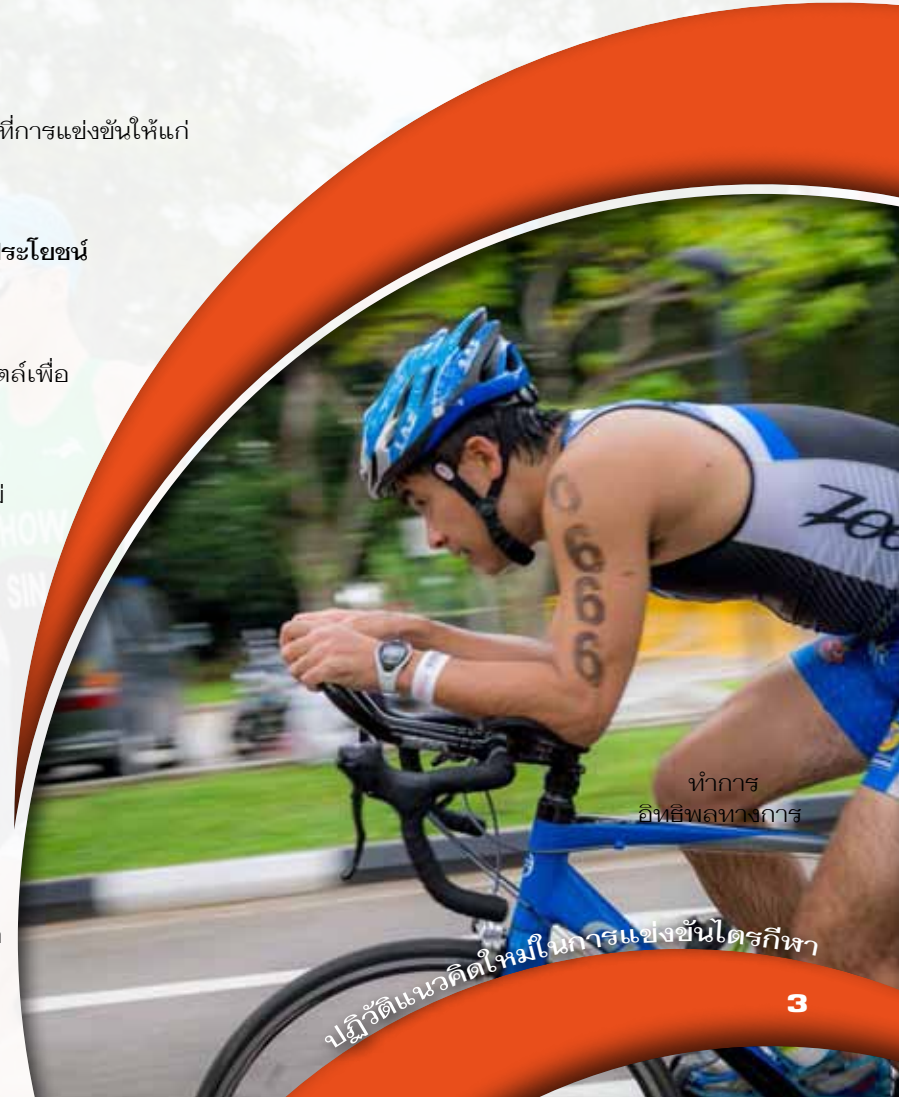
ทำการ อิทธิพลทางการ

เข้าถึงผู้บริโภคในภูมิภาค – โอกาสในการขายสินค้าและบริการในระดับภูมิภาคและเข้าถึงนักกีฬาในภูมิภาคเอเชียแปซิฟิก