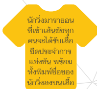
นักวิ่งมาราธอน ที่เข้าเส้นชัยทุก คนจะได้รับเสื้อ ยืดประจำการ แข่งขัน พร้อม ทั้งพิมพ์ชื่อของ นักวิ่งลงบนเสื้อ