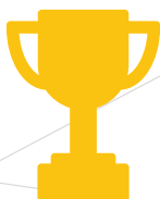
ถ้วยรางวัล