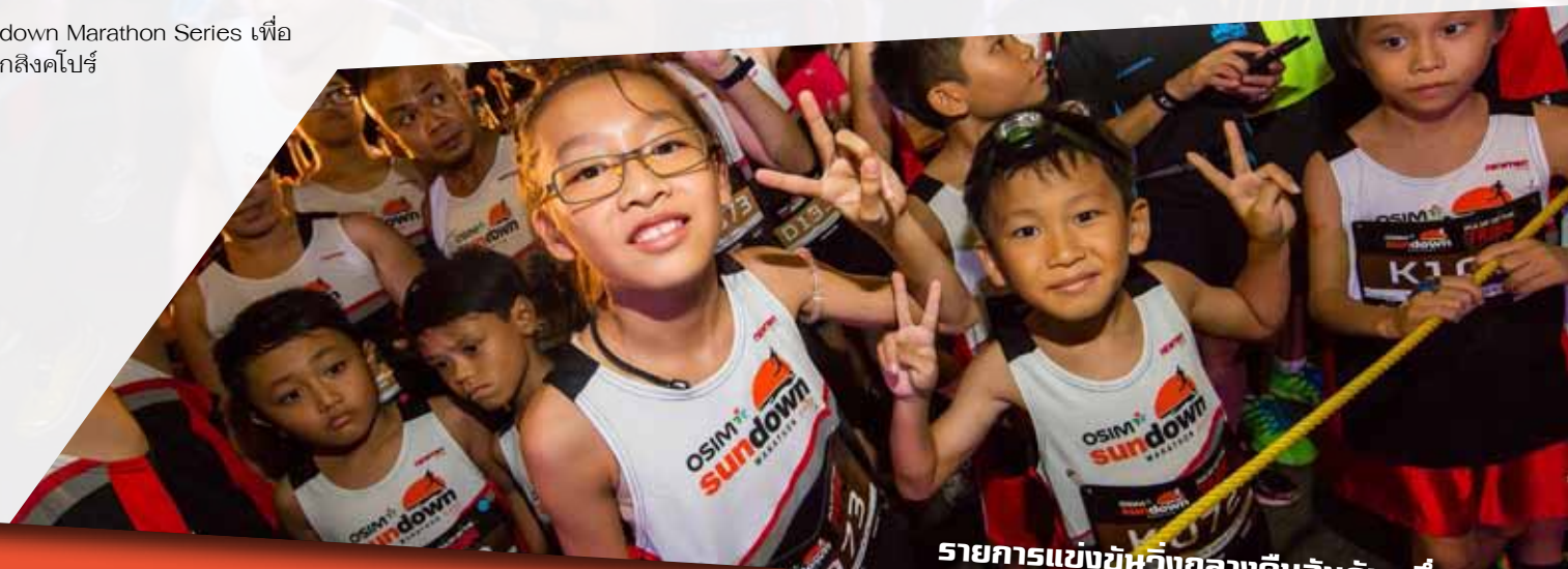
รายการแข่งขันวิ่งกลางคืนอันดับหนึ่ง...

นอกจากจะมีกิจกรรมต่างๆ มากมายภายในงานแล้ว งานแสดงสินค้านี้ยังถือเป็นเวทีที่เปิดโอกาสให้ผู้สนับสนุนรายการได้ประชาสัมพันธ์สินค้าและบริการอย่างเต็มที่ ทั้งในลักษณะของการเปิดบูธเพื่อตั้งแสดงและจำหน่ายสินค้า ตลอดจนทำกิจกรรมแจกตัวอย่างสินค้า