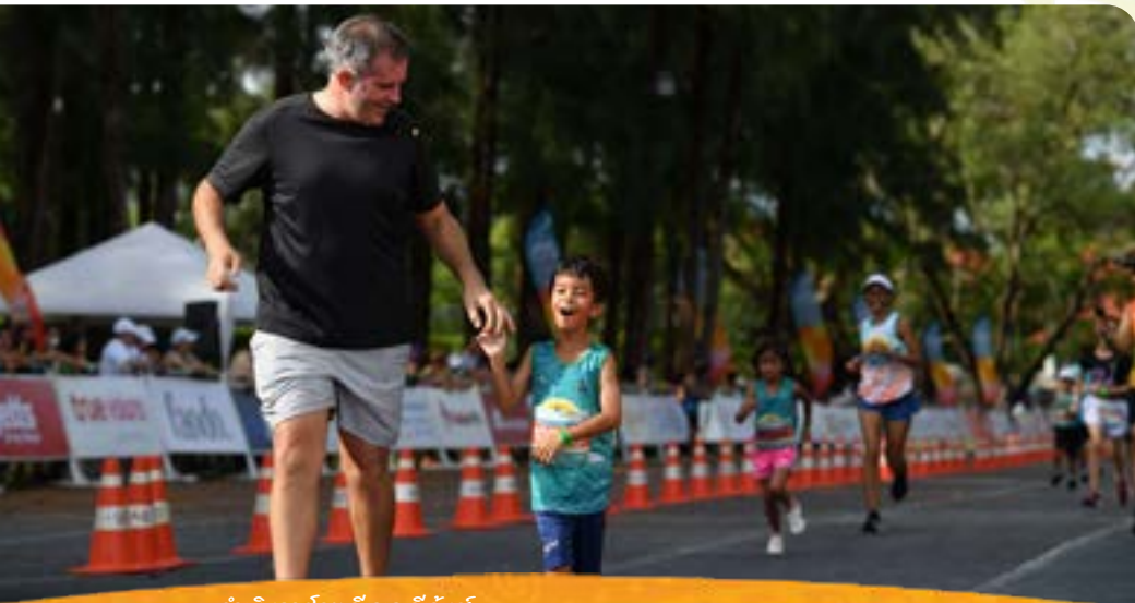
ดำเนินการโดย จีเอเอ อีเว้นส์ สนับสนุนการตลาดโดยบริษัท พอล พูล (เซ้าท์ อีส เอเชีย) จำกัด - ผู้เชี่ยวชาญด้านการสนับสนุนการตลาด

สาระสำคัญของการจัดงานนี้ไม่ได้อยู่ที่การแข่งขันเพื่อทำลายสถิติโลก หากแต่เป็นการสร้างประสบการณ์การแข่งขันที่น่าประทับใจผ่านการนำเสนอทัศนียภาพอันงดงามของภูเก็ต พร้อมให้สมาชิกในครอบครัวร่วมสร้างความทรงจำดี ๆ เช่น เติมน้ำด้วยเครื่องดื่มและรอยยิ้มร่วมกัน ฟันการลงแข่งขันวิ่งหลากหลายประเภทที่ทุกคน ทุกช่วงอายุ และทุกระดับสมรรถนะสามารถเลือกเข้าร่วมได้อย่างอิสระ