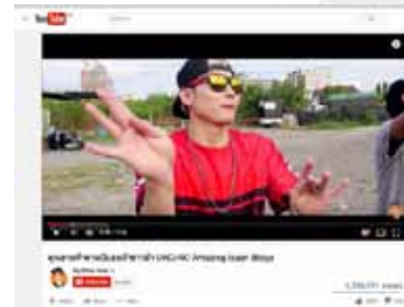
"BBOY VS. GRANDM" (YOUTUBE) - 1.4 ล้านวิว