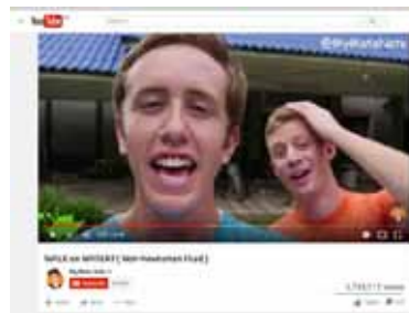
"WALK ON WATER" (YOUTUBE) - 1.6 ล้านวิว