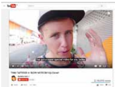
"THAI TATTOOS IN SLOW MOTION" (YOUTUBE) - 2.1 ล้านวิว