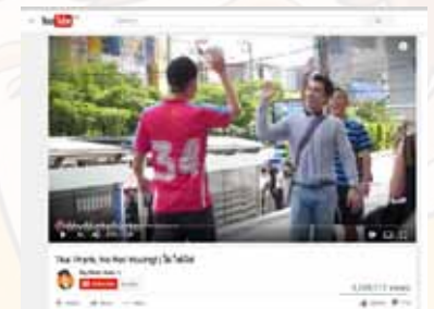
"NO NOT YOU-ING" (YOUTUBE) - 1.3 ล้านวิว