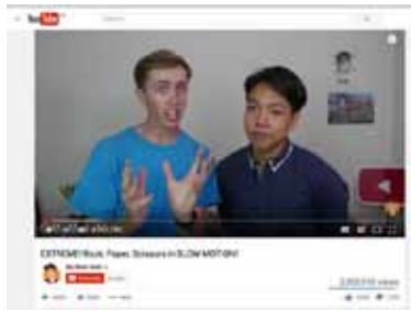
"ROCK PAPER SCISSORS SLOW MO" (YOUTUBE) - 2 ล้านวิว